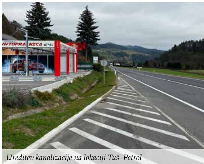
Ureditev kanalizacije na lokaciji Tuš-Petrol

Vesna NOVAK TEMNIKER, podsekretarka za razvojne naloge