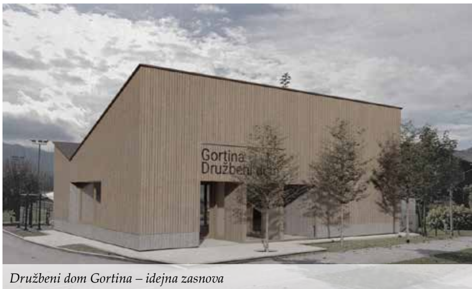
Družbeni dom Gortina – idejna zasnova

V pretekli številki Mučana smo že predstavili investicijsko namero Občine Muta in dolgoletno željo občanov na območju Športnega parka Gortina. Cilj je pridobiti objekt, ki bo zagotavljal ustrezen prostor športni dejavnosti, izboljšanje športne infrastrukture, izboljšanje turistične prepoznavnosti kraja, pridobitev prostorov za izvedbo kulturnih in drugih spremljevalnih vsebin itd.