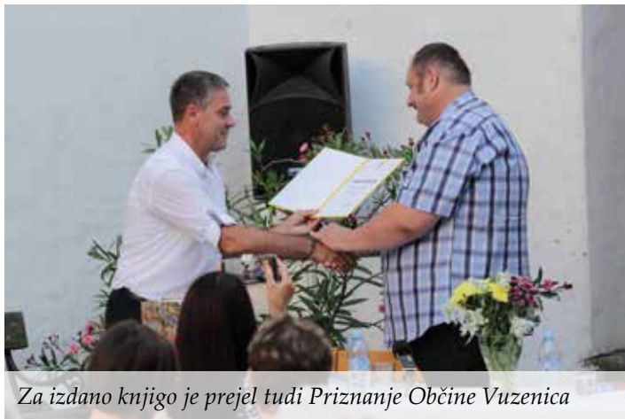
Za izdano knjigo je prejel tudi Priznanje Občine Vuzenica

nič in o kakršnikoli magistralih ne bi mogli niti govoriti, kaj šele o magistralnem sonetnem vencu in magistralu magistralov, ki je zaključni sonet te zbirke. Njegov akrostih se glasi »Slovenski narod«, kot je tudi naslov celotne zbirke. Čeprav je v knjigi uvrščen na zadnje mesto, je časovno gledano prvi po nastanku. Nato sem se lotil preostalih štirinajstih magistralnih sonetov, ki imajo tudi vsak svoj akrostih in skupaj tvorijo magistralni sonetni venec, šele potem pa vseh ostalih »navadnih« sonetov, ki so dali preostalih štirinajst sonetnih vencev. Končni magistralni sonetni venec je nekakšna krona vsega in tudi vsebinski povzetek celotne pesniške zbirke.