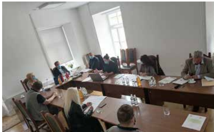
Sestanek s člani komisije, občinske uprave in Društva invalidov Muta

Prejem listine je zaveza Občine Muta, da tudi v bodoče uresničuje naloge Akcijskega načrta, da letno poroča o realiziranih nalogah ZDIS-u, da Svet Občine Muta vsakoletno potrdi Akcijski načrt,