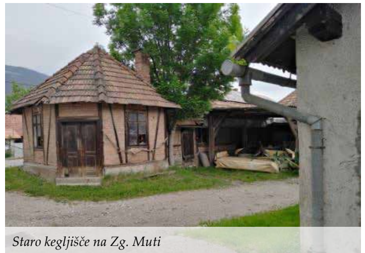
Staro kegljišče na Zg. Muti

Pobuda za razvoj projekta je na strani Občine Muta, osnovne šole in vrtca. Pričakovani cilj, kjer bo z investicijo investitor zasledoval namene kakovostne ureditve širšega šolskega okoliša Zg. Mute in preudarno ravnal s prostorom kot tudi z objekti, je končna izvedba revitalizacije, s čimer pa bodo fazno realizirani sklopi ureditve površin, ki bodo imele skupni pomen za medgeneracijsko druženje,