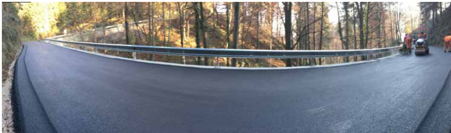
Nova asfaltna cesta po sanaciji plazu Matij

V neurju 24. 8. 2019 je na cesti Sp. Muta – Gumpat, malo pod kmetijo Matij, zaradi velike količine padavin in materiala, ki ga je hudourniški potok nosil s sabo, odtrgalo del ceste. Cesta je bila zaradi zemeljskega plazu ob potoku Matij precej ozka, zato je bila kar nekaj časa zaprta za ves tovorni promet in šolske prevoze.