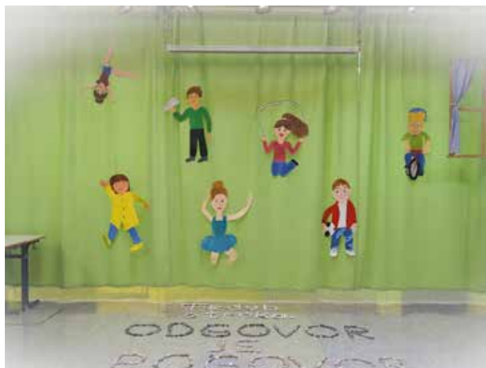
Teden otroka v avli šole

Moje mnenje je, da se moramo čim prej vrniti v šolo, da bomo lahko odgovorno in z vsem srcem uresničevali naše poslanstvo in vizijo. Morda kot prednost pouka na daljavo izpostavim predvsem večjo samostojnost dijakov pri učenju in vsaj v večini primerov