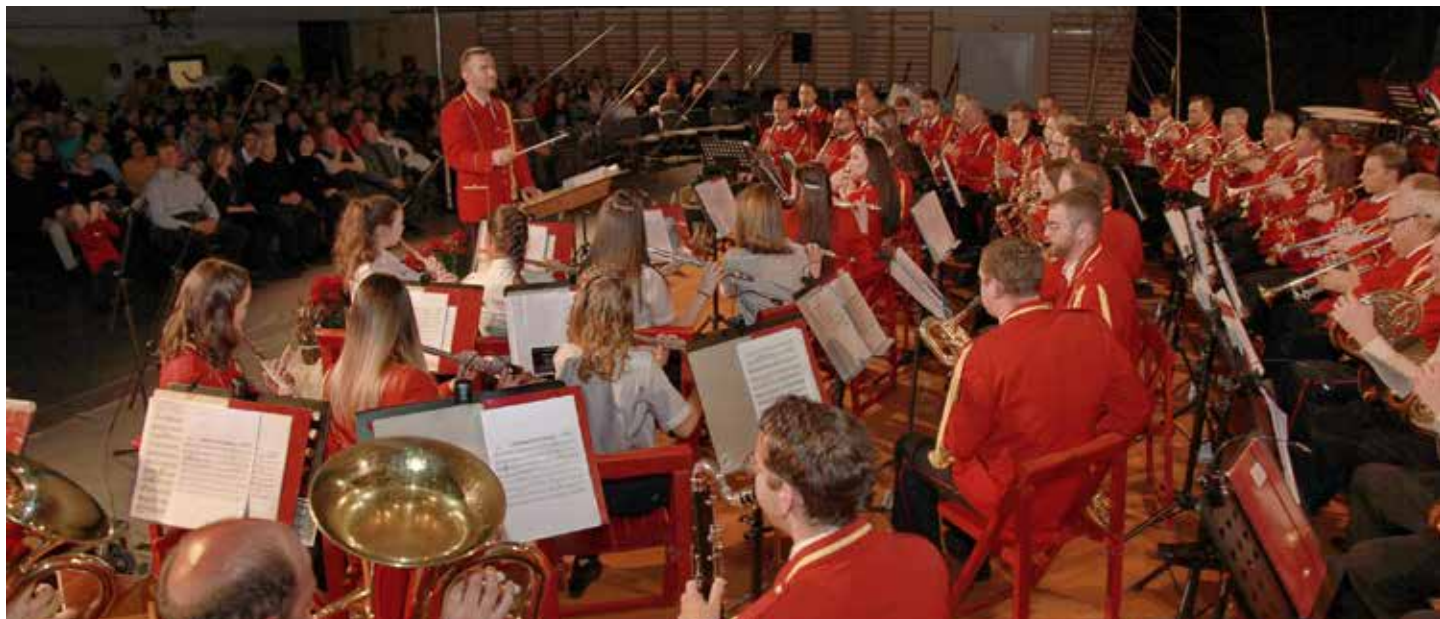
Godbeniki z dirigentom Društva pihalni orkester Muta

Letošnje leto praznuje Pihalni orkester Muta 125-obltnico delovanja, ki pa je vsekakor v marsikaterih pogledih drugačna od prejšnjih. To je dolga doba, v kateri so delovali godbeniki različnih generacij in kakor so bili oni v različnih obdobjih postavljeni pred različne življenjske preizkušnje, tako smo tudi mi letos postavljeni pred dejstvo epidemije.