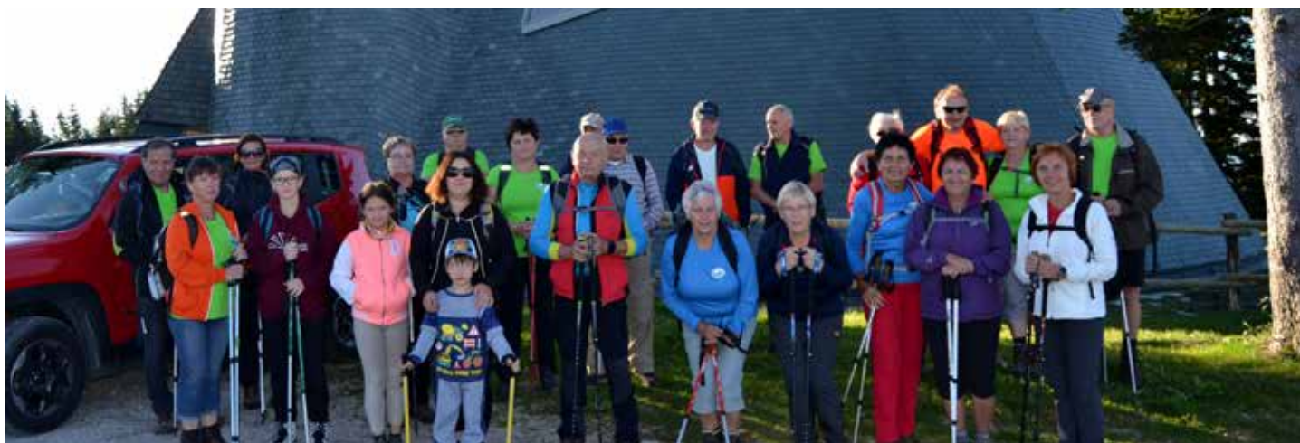
Skupinska fotografija na Rogli