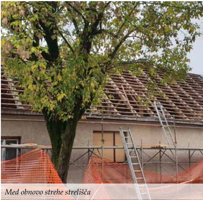
Med obnovo strehe strelišča

V letu 2020 je potekala obnova strelišča na Zg. Muti, v okviru katere smo zamenjali streho in staobno pohištvo. Investicija je bila sofinancirana s strani Ministrstva za gospodarski razvoj in tehnologijo, in sicer v višini 16.000 EUR.