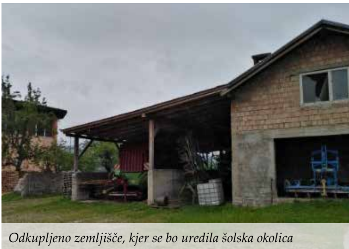
Odkupljeno zemljišče, kjer se bo uredila šolska okolica

V letu 2020 smo pričeli s pripravo projektne naloge revitalizacije šolskega okoliša, ki se navezuje na funkcionalno zemljišče v neposredni okolici v velikosti cca. 4.000 m 2 s pripadajočimi gospodarskimi objekti in stanovanjsko hišo. Temeljni razlogi za investicijsko namero ob nakupu kmetije so dolgoletno vloženi naporji za potencialno razširitev pomembnejšega območja Zg. Mute ter s tem izboljšanje kakovosti obstoječega šolskega okoliša.