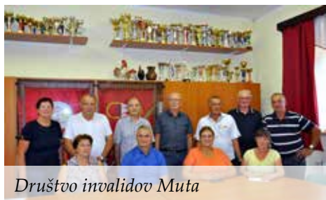
Društvo invalidov Muta

Dokler imamo spomine, obstaja preteklost. Dokler imamo upanje, nas čaka prihodnost. Dokler imamo prijatelje, je lepa sedanost.