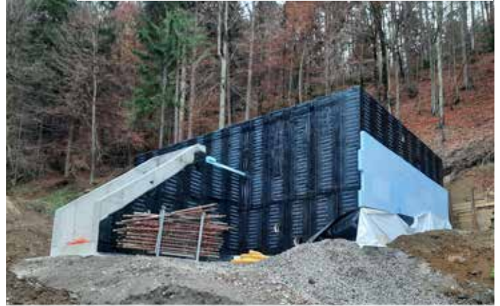
Vodohran na Sv. Primožu