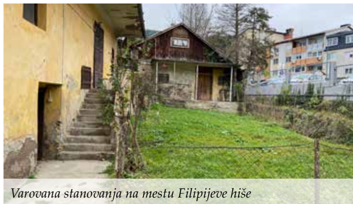
Varovana stanovanja na mestu Filipijeve hiše

Kot je dejala raziskovalka Nahtigal: »Zelo dobro vemo, kaj je naš cilj pri izvedbi projekta; kako bomo to dosegli in na kakšne težave bomo pri tem naleteli, pa je seveda stvar delovnega procesa v naslednjih treh letih. Načrtujemo, da bomo v tem času preselili 70 uporabnikov iz centralne zgradbe v 13 manjših stanovanjskih enot v šestih koroških občinah. Za vsakega bo narejen osebni načrt, potrebno bo veliko sodelovanja z uporabniki, starši oz. skrbniki, zaposlenimi in lokalno skupnostjo.«