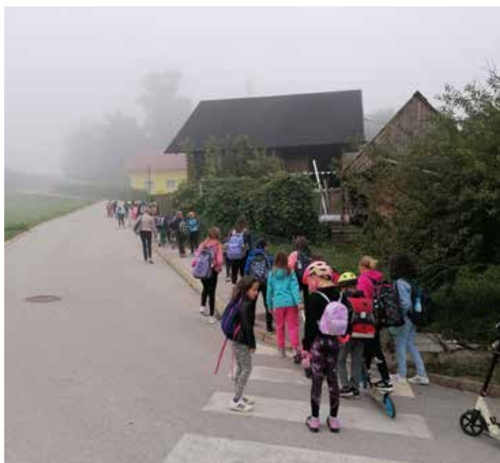
Aktivno v nov dan