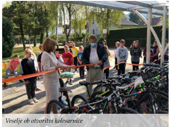
Veseljje ob otvoritvi kolesarnice