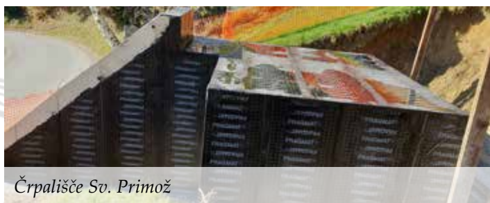
Črpališče Sv. Primož