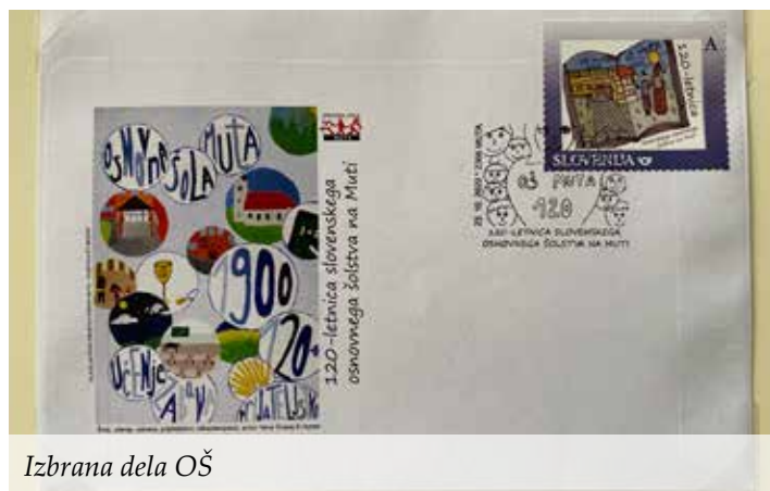
Izbrana dela OŠ

mentorstvom vzgojiteljic. V šolskem natečaju pa so sodelovali vsi učenci od 1. do 9. razreda. Na razredni stopnji so učenci ustvarjali pod mentorstvom svojih učiteljic, starejši učenci pa so ustvarjali pri urah likovne umetnosti, pri likovnem krožku in nekateri tudi