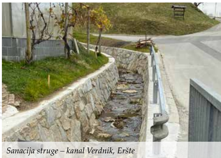
Sanacija struge – kanal Verdnik, Eršte

Že več let so se občani Mute srečevali s problemom prestopanja bregov levega pritoka Filipijevega potoka in poplavljanja spodnjega dela Ceste ob potoku (vzhod) ter stanovanjskega objekta na naslovu Cesta ob potoku 10.