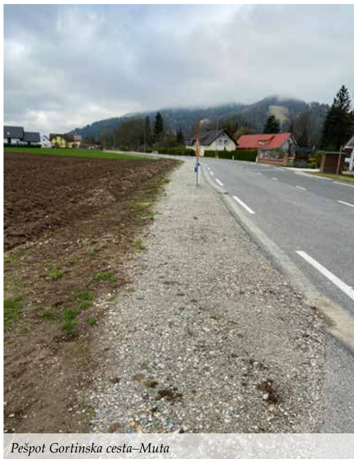
Pešpot Gortinska cesta–Muta