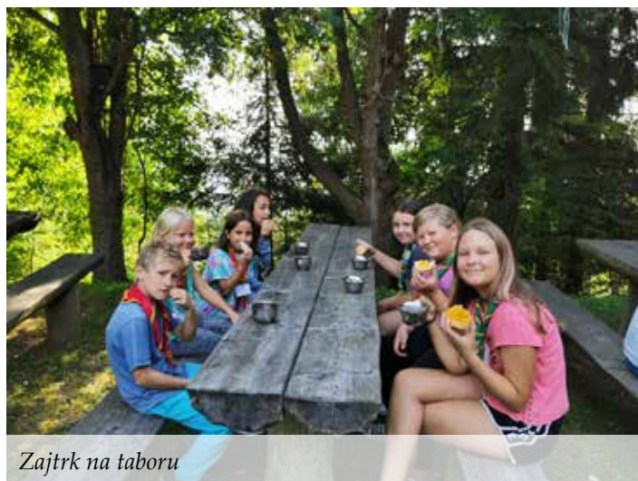
Zajtrk na taboru

Kljub vsem preprekam smo se med 12. in 16. avgustom podali na letni tabor. Preživeli smo čudovite dni na Pernicah, kjer smo lahko