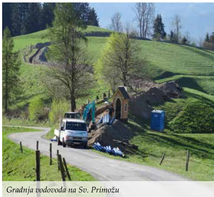
Gradnja vodovoda na Sv. Primožu