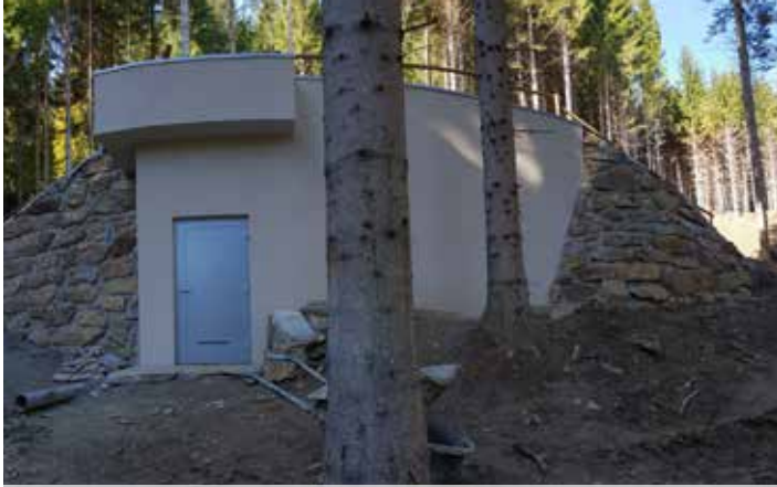
Zbiralnik vode v Avstriji – Laaken