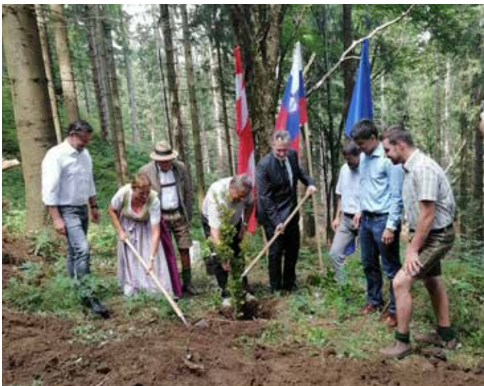
Posaditev drevesa na meji med Slovenijo in Avstrijo