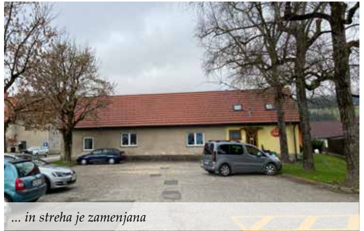
... in streha je zamenjana