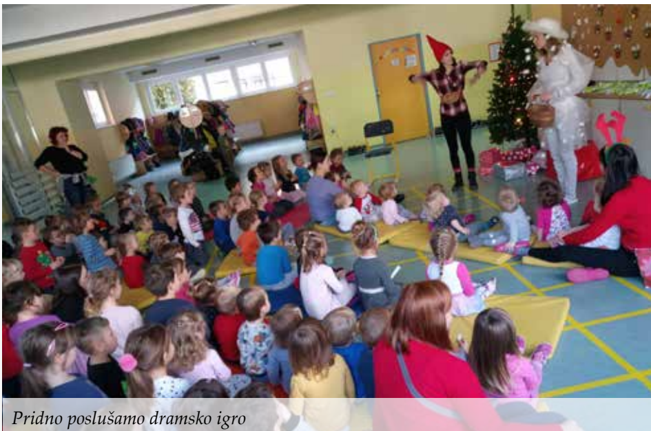
Pridno poslušamo dramsko igro

Prihaja prav poseben čas, najbolj čaroben mesec, mesec december. Tudi v vrtcu se ta začne pravljичno, čarobno, igrivo in z nasmejanimi obrazi naših najmlajših. V vrtcu nas vsako leto pričakajo skrivnostna pisma različnih pravljичnih junakov (zvezdice Zaspanke, muce Copatarice, snežaka Martina, nagajivega palčka ...). Prejeta pisma prazničen december spremenijo v skrivnosten, čaroben, pravljичen, igriv in poseben, drugačen čas. Tako v tem času v vsaki skupini nastajajo otroške dekoracije oken, prostorov in garderobe. Iz igralnic diši po peki piškotov, ki jih otroci pripravijo skupaj s svojimi vzgojiteljicami. Poseben čas namenimo skupnemu druženju ob prebiranju pravljic, prepevanju prazničnih pesmic ob spremljavi harmonike, kitare, klavirja. Zarajamo in zaplešemo v telovadnici na posebnem novoletnem plesu. Poleg vseh pestrih dejavnosti pa otroke še posebej razveseli prihod babice Zime in dedka Mraza. Takrat strokovne delavke za otroke pripravimo lutkovno ali dramsko igro, s katero pričaramo nasmeh na obraz