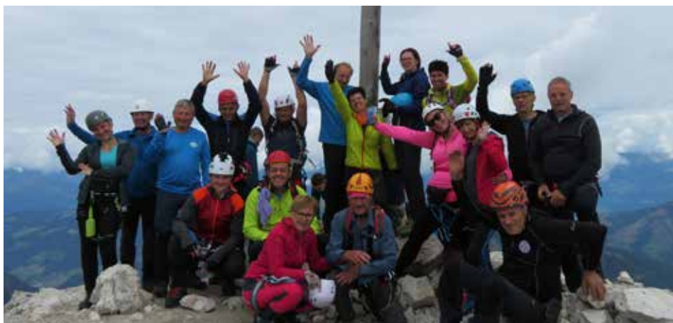
Na vrhu Petlerkofla v Dolomitih

vse skupinske izlete, torej v glavnem avtobusne, in priznati moram, da jih že močno pogrešamo. Pogrešamo druženje s tistimi, s katerimi smo radi skupaj. Saj smo kar velika družina, družina enako mislečih,