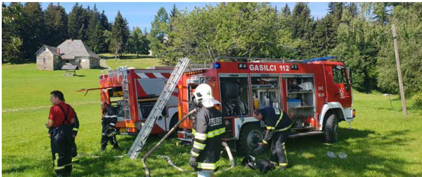
V akciji je sodelovalo veliko prostovoljcev, še posebej gasilcev