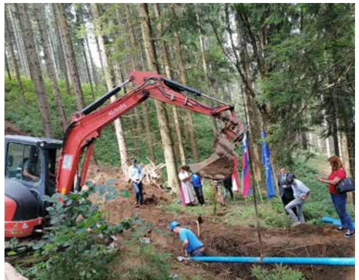
Položitev zadnje cevi na avstrijski strani