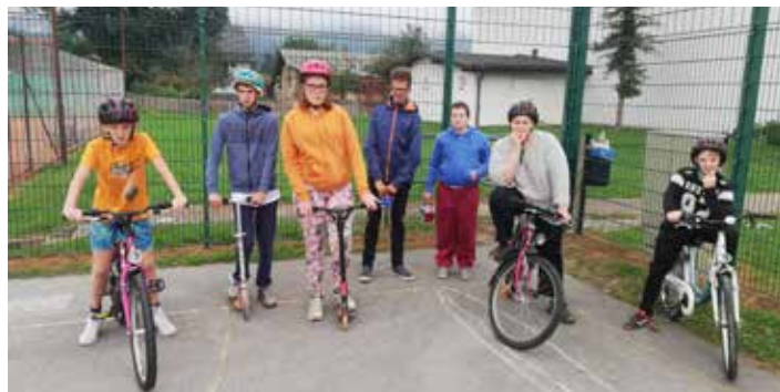
Trajnostna mobilnost na OŠPP

V tednu mobilnosti smo beležili načine prihoda v šolo, hodili peš, se vozili s kolesi in skiroji ter z dodatnimi aktivnostmi krepili zavedanje o pomenu skrbi za okolje in naše zdravje. Šolarje je v času projekta spremljala kokoška Rozi, ki jih je nagradila s