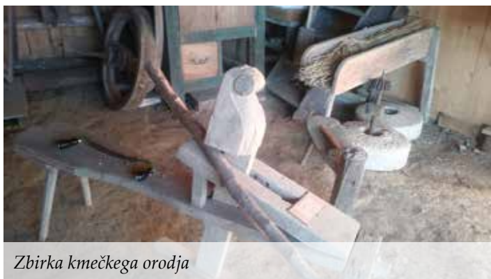
Zbirka kmečkega orodja