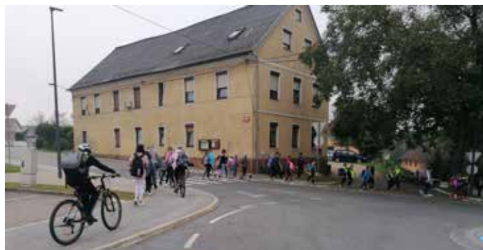
Sprehodi s Sp. Mute

V tednu med 16. in 22. septembrom je potekal Evropski teden mobilnosti pod sloganom »Gremo peš s kokoško Rozi«. Del tega smo bili tudi učenci OŠ Muta, ki smo od srede do torka hodili v šolo peš, s kolesi ali skiroji. Zjutraj smo se zbrali na treh točkah, in sicer na igrišču na Gortini, pri OŠ Muta ter pri Marketu na Spodnji Muti, ter se v spremstvu učiteljev podali proti šoli. Izpolnjevali smo tudi razredni plakat o prihodih v šolo. Tedna mobilnosti so bili veseli predvsem naši najmlajši, saj so lahko v šolo hodili skupaj s sošolci. Seveda pa je bilo vseh tudi nam starejšim, ker smo lahko pomagali paziti na varnost najmlajših. Poleg tega smo se pred poukom dobro razgibali in se naužili svežega zraka, da smo bili pri urah bolj osredotočeni na snov. Prepričani smo tudi, da je