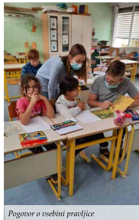
Pogovor o vsebini pravljice