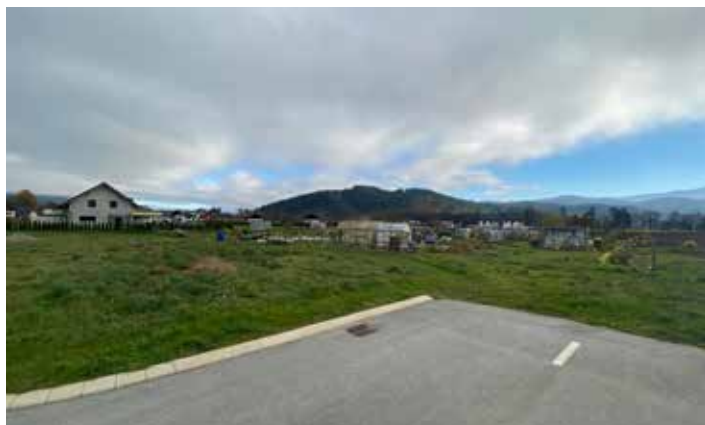
Izgradnja komunalne infrastrukture na območju SE3