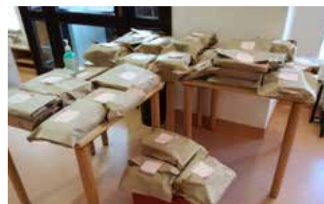
Pripravljeni paketi knjig

tiste možnosti, ki bodo vendarle omogočale, da bomo v vseh naših enotah lahko na nek način izposojali tudi fizične izvide našega gradiva. Vsi uporabniki, sploh starejši, namreč nimajo ustrezne opreme pa tudi ne znanja oz. veščin, da bi uporabljali samo elektronske knjige, časopise in revije. Pri tem pogosto izpostavljamo starejše in zanemarimo otroke ter mlade, za katere je stik s knjigo na papirju prav tako zelo pomemben, še posebej na primer za šolarje, ki so v tem času šolanja na daljavo tako ali tako pred ekrani domala cele dneve. Za knjižnice v Sloveniji je bila prepoznavna in odločilna oblast, da vendarle lahko izvajamo knjižnično dejavnost ob upoštevanju vseh varnostnih ukrepov, zelo pomembna. Omogočanje dostopa do knjig in drugega gradiva, četudi brezstično, z naročanjem po telefonu ali elektronsko, je po naših izkušnjah zelo dober kompromis, kjer se tako knjižničarji kot uporabniki počutimo varne in smo zadovoljni. Bralci, ki obiskujejo knjižnico na Muti, so se razmeram takoj prilagodili. Ob sicer kratkih obiskih, ko gre več ali manj zgolj za vračilo in prevzem pripravljenega paketa knjig, tudi ni prave priložnosti za pogovor. Kljub temu so na kratko izrazili