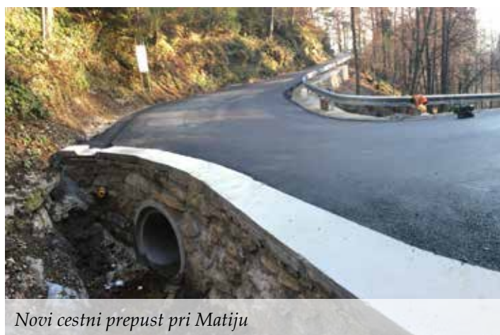
Novi cestni prepust pri Matiju