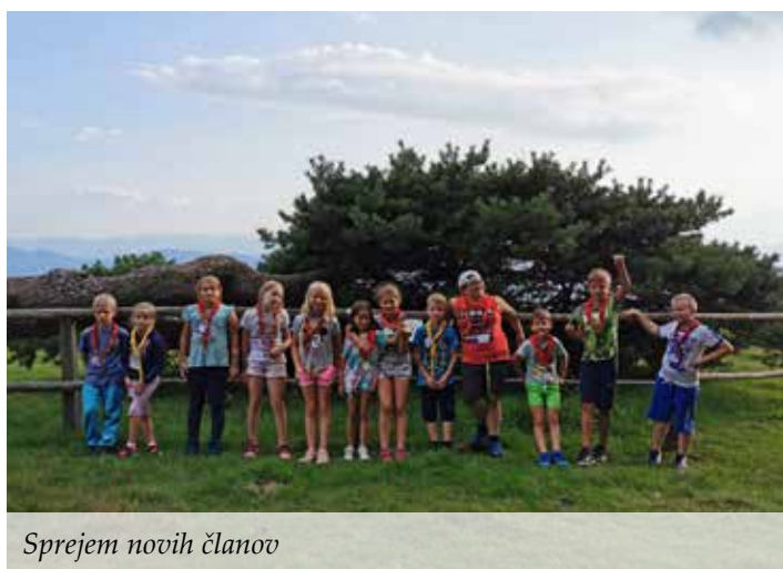
Sprejem novih članov

Tako kot za vsa društva je leto 2020 zelo težko tudi za tabornike. Vodova srečanja so do meseca marca potekala nemoteno. Žal pa smo morali odpovedati zimovanje 2020 in vsa vodova srečanja od marca naprej. Vsekakor pa nismo spali. Preko spleta smo v času prvega vala korone delili in sodelovali na taborniški ropotarnici. Konec marca smo sodelovali na svetovnem dogodku Ura za zemljo, kjer smo pozvali vse člane in občane, naj za eno uro ugasnejo vse luči. Prostovoljci, odrasli taborniki, smo sodelovali preko civilne zaščite in smo bili na razpolago ves čas. Tako smo pomagali tudi pri razvozu hrane.