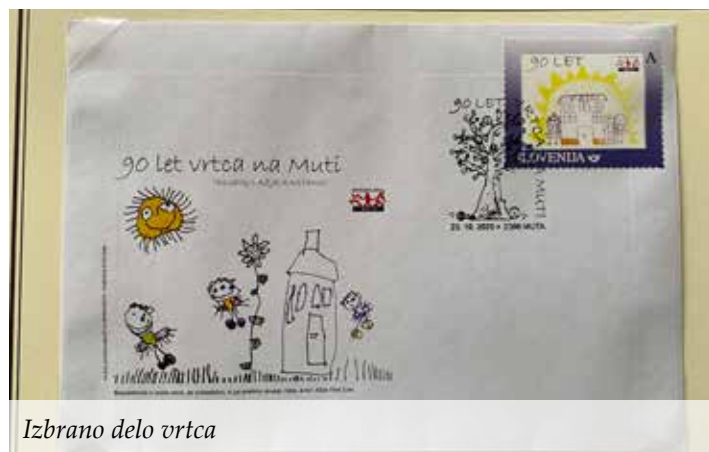
Izbrano delo vrtca

pri razrednih urah. Motiv, ki bi simboliziral 90 let vrtca in 120 let slovenske šole na Muti, so otroci izbirali sami oz. s pomočjo svojih mentoric. Nastala so čudovita otroška likovna dela z bogato simboliko in otroškim razmišljanjem, kaj jim vrtec oz. šola pomeni in kakšen pomen imata za naš kraj.