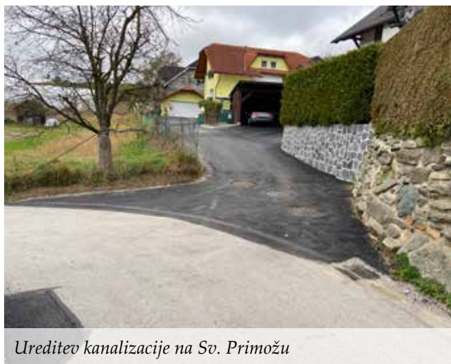
Ureditev kanalizacije na Sv. Primožu

Kanalizacijski sistem v občini Muta se je v letu 2020 izvedel kot ločen sistem za odvodnjo komunalnih in padavinskih odpadnih voda na območju naselja Sv. Primož. Tako meteorni kot komunalni kanalizacijski sistem sta zasnovana tako, da se odpadne vode zbirajo v eni točki. Komunalne odpadne vode se stekajo v obstoječo komunalno kanalizacijo, ki nadalje vodi odpadne vode na obstoječo čistilno napravo. Padavinske vode pa se stekajo v predviden meteorni kanal in nadalje v obstoječ meteorni kanal s končno dispozicijo padavinske vode v reko Dravo. Meteorni kanalizacijski sistem sestavlja ena kanalska veja, ki je smiselno razporejena po območju glede na terenske danosti, niveletni potek ceste in način odvodnje posameznih objektov. Sočasno se je ob zaključevanju del na pobude in sofinanciranje tamkajšnjih krajanov, kateri so konstruktivno in strpno sodelovali pri razreševanju tekoče problematike, asfaltiralo del občinske lokalne dovozne ceste.