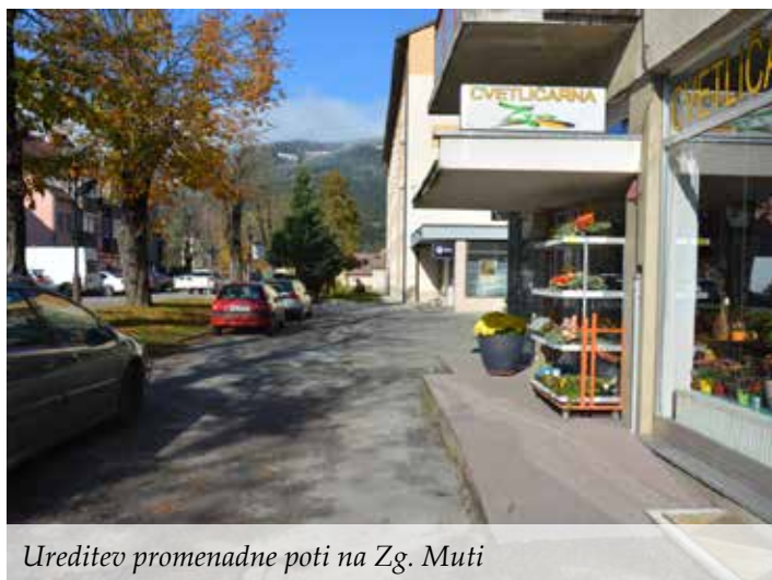
Ureditev promenadne poti na Zg. Muti

Župan Občine Muta se je prvič v zgodovini občine odločil, da na podlagi 13. a-člena ZJF pripravi in občinskemu svetu v obravnavo predloži predlog proračuna za naslednje koledarsko leto 2021 ter predlog proračuna za leto, ki temu sledi, tj. leto 2022, in je še znotraj mandatnega obdobja, za katerega sta bila izvoljena občinski svet in župan.