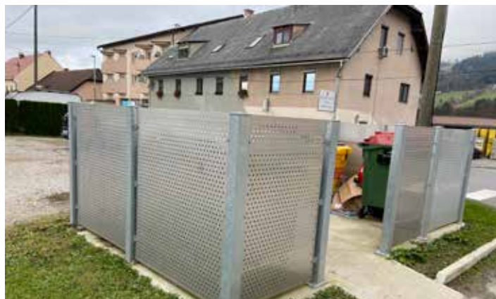
Ureditev zbirališč odpadkov – Zg. Muta