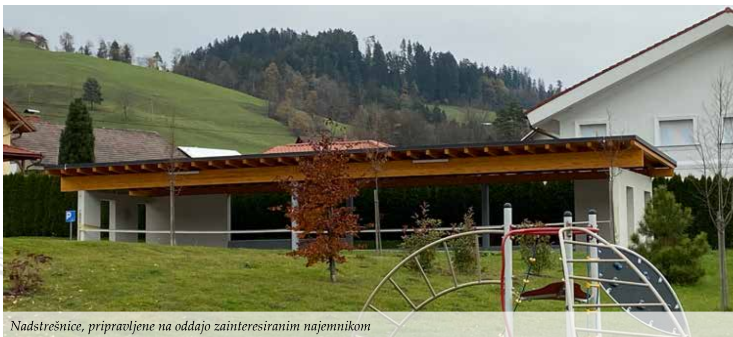
Nadstrešnice, pripravljene na oddajo zainteresiranim najemnikom