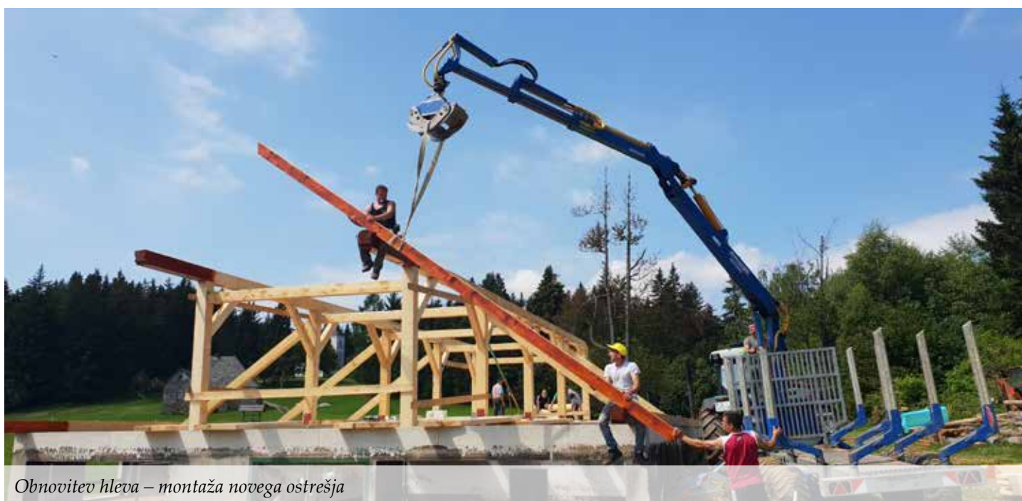
Obnovitev hleva – montaža novega ostrešja