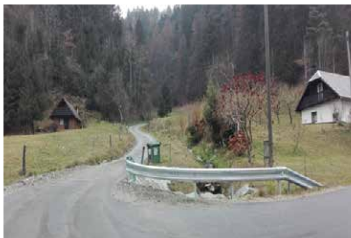
Vzdrževanje občinskih in gozdnih cest – Bistriški jarek