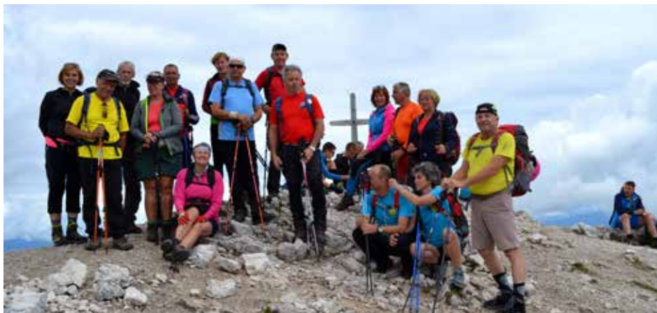
Utrujeni, a nasmejani

Letošnje leto je za naše društvo, kakor tudi za vsa ostala društva v občini in širom po Sloveniji, ki se ukvarjajo z rekreativno dejavnostjo, posebno, turobno leto. Prikrajšani smo namreč za skoraj