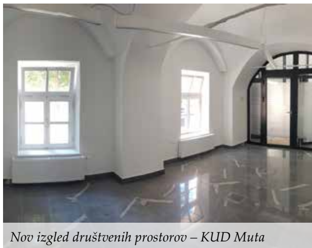
Nov izgled društvenih prostorov – KUD Muta