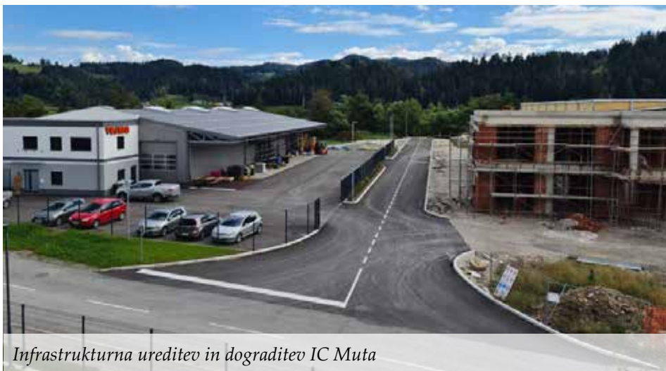
Infrastrukturalna ureditev in dograditev IC Muta

Skupno je bilo izgrajenih 200 m dveh asfaltiranih uvoznih cest, 1,7 km kanalizacijskega voda, črpališče, javna razsvetljava, vodovodna napeljava, odvodnjavanje meteornih voda ter telekomunikacijska infrastruktura. S tem se je opremilo 2,05 ha območja, namenjenega za gradnjo industrijskih objektov.