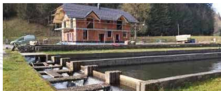
Nesreča (pogin rib) se je pripetila tudi v Ribogojnici Peruš

Prve septembrske dni pa je izgubo dela vira dohodka doživela še ena marljiva družina, družina Peruš iz Bistriškega jarka, znana kot Ribogojnica Peruš. V noči iz nedelje na ponedeljek, 7. 9. 2020, je proti jutru prišlo do nenadnega povečanja vodotoka Bistrice z ogromno količino vejevja in mulja. To je povzročilo popolno zaporo dotoka vode v ribogojnico in posledično pogin večine rib. Kljub zelo hitremu posredovanju in velikim telesnim naporom ob reševanju so izgubili preko 60 % vseh rib. Družina je naredila vse, kar je bilo v njihovi moči za omejitev škode in odpravo posledic nesreče, ki jih bodo občutili tudi dolgoročno. Tudi Peruševim smo skupaj z OO RK Radlje ob Dravi pomagali z akcijo zbiranja denarnih sredstev, ki jim bo vsaj delno pomagala pri premostitvi izgube sredstev zaradi povzročene škode.