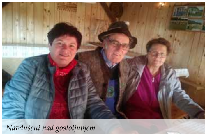
Navdušeni nad gostoljubjem

Bla sta dara prjotla. Tam, ke sta meji june havžnge kup prišli, sta postajla no klop in hodla ta sedet. Če ž med kednom ni blo cajta, ob nedelah pa gvišno. Pa sta se mienla, kak kiri havžje, kak so otroci