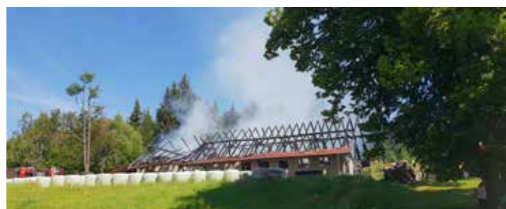
Uničena streha gospodarskega poslopja